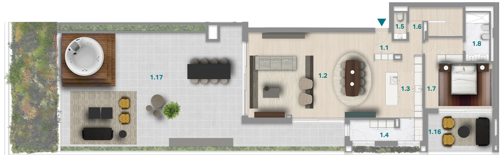
PISO 5 5 TH FLOOR