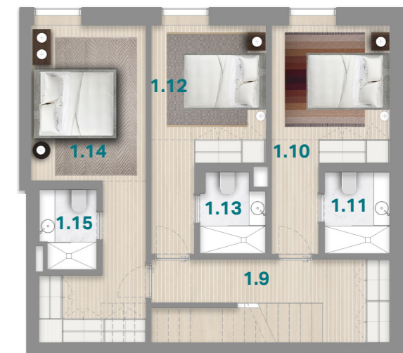
PISO 4 4 TH FLOOR

APARTAMENTO BP ENTRADA A APARTMENT ENTRANCE