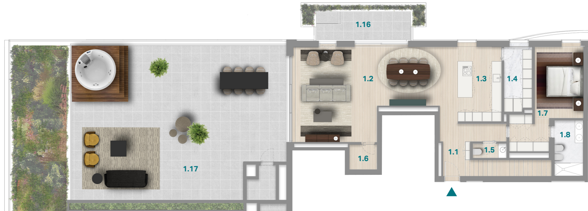
PISO 5 5 TH FLOOR